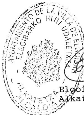
Elgoibarko Udaleko Alkate-Lehendakaria

Eta honela jasota uzteko eta adostasuna agertzeko, honako hitzarmen hau egin eta hasieran aipatutako toki-egunetan izenpetzen dute bildutakoek.