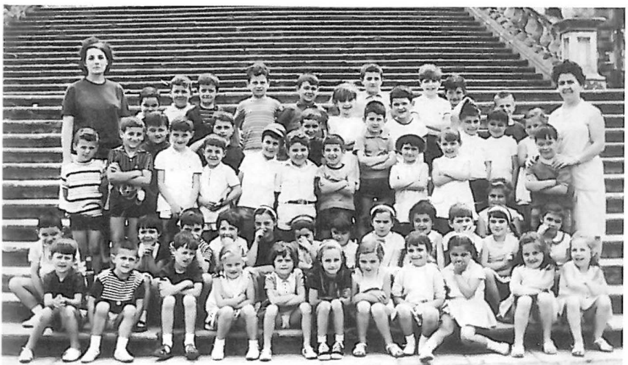
"Lehelengo umien gurasuen merittua izugarrixa izan zan"